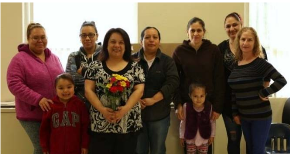
Parents and children alike have enjoyed the "Cafecito con Angela" workshops held at North school!