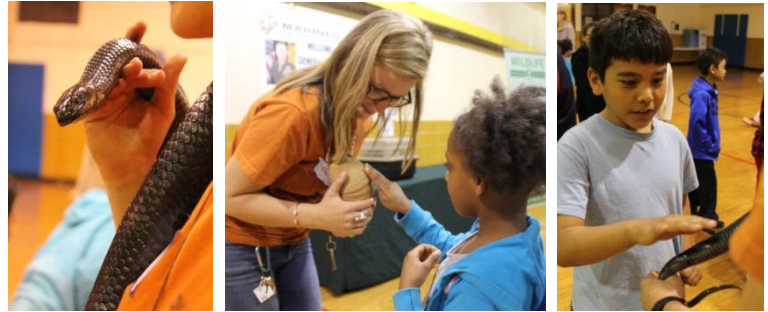
The After School Enrichment Program students had so much fun meeting a real life armadillo!

¡Saludos! Espero que todos se encuentren con buen ánimo y salud. Es increíble que sólo nos queden unas pocas semanas de escuela. Con eso, la Academia ha estado comenzando a planear nuestros programas de recompensas de fin de año para todos los cadetes que se han quedado en el rango y están en camino a la caballería. Los Caballeros y Damas de primer año se dirigirán a Medieval Times en Roselle, Illinois para la cena y un torneo. Los Caballeros y Damas del segundo año se dirigirán a una aventura llena de diversión en el Territorio de Acción en Kenosha, Wisconsin, y nuestros Caballeros y Damas del tercer año se dirigirán a Chicago, Illinois para recorrer el Navy Pier y cenar en el restaurante Signature Room, que está en la 95 piso del Centro John Hancock! A medida que nos comprometemos a mostrar a sus cadetes las grandes recompensas que provienen de un comportamiento apropiado, académicos y asistencia, nuestra meta es continuar ofreciendo estas oportunidades cada año. La Academia está buscando su apoyo en esto también. Si sabe de alguna persona que puede hacer una donación a cualquiera de nuestros programas de recompensas de fin de año, por favor, pídale que lo hagan. Los cheques y/o giros postales pueden hacerse pagaderos al AJK Activity Fund. Si tiene alguna pregunta, no dude en comunicarse conmigo en persona o por correo electrónico a mgrenda@d187.org .